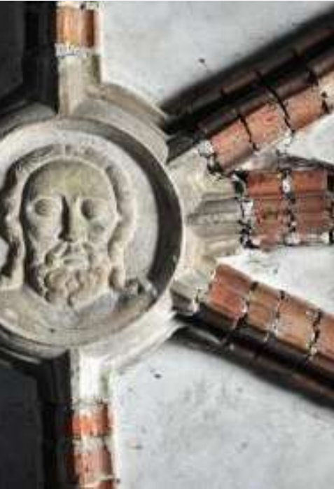
Kwaliteit: talenten en middelen