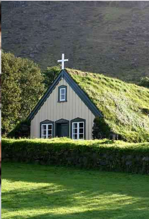
Groen en duurzaam