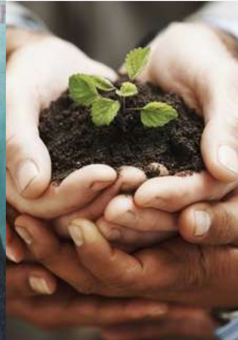
Groeiend in geloof